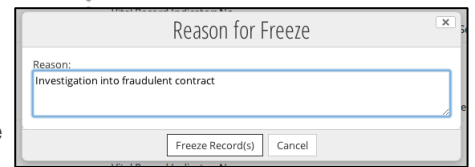
Conservazione ai fini legali